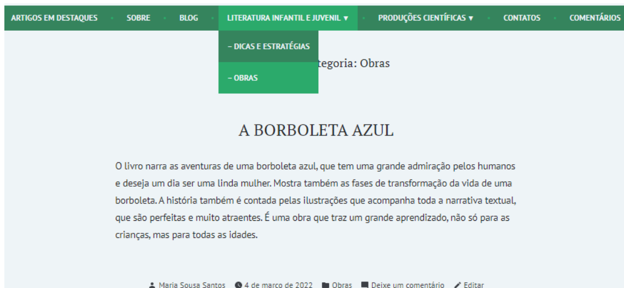
Figura 5: página Literatura Infantil e Juvenil , subpágina, Obras .

A página Produções Científicas , demonstrada na figura 6, contém atualmente a subpágina Artigos , mas pretendo acrescentar ainda, outras subpáginas, nas quais serão postadas diversas produções acadêmicas relevantes para a área em estudo.