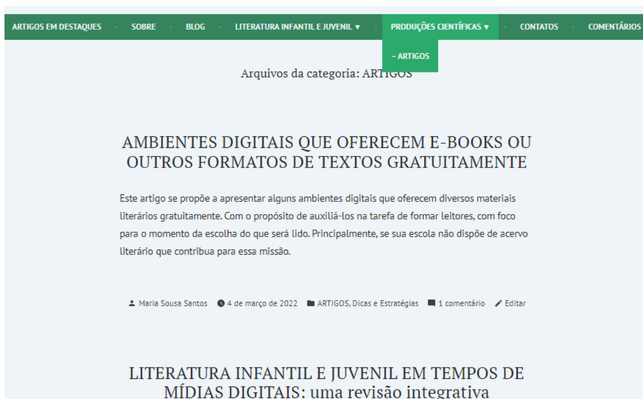
Figura 6: página Produções científicas , subpágina Artigos .

A página Produções Científicas , demonstrada na figura 6, contém atualmente a subpágina Artigos , mas pretendo acrescentar ainda, outras subpáginas, nas quais serão postadas diversas produções acadêmicas relevantes para a área em estudo.