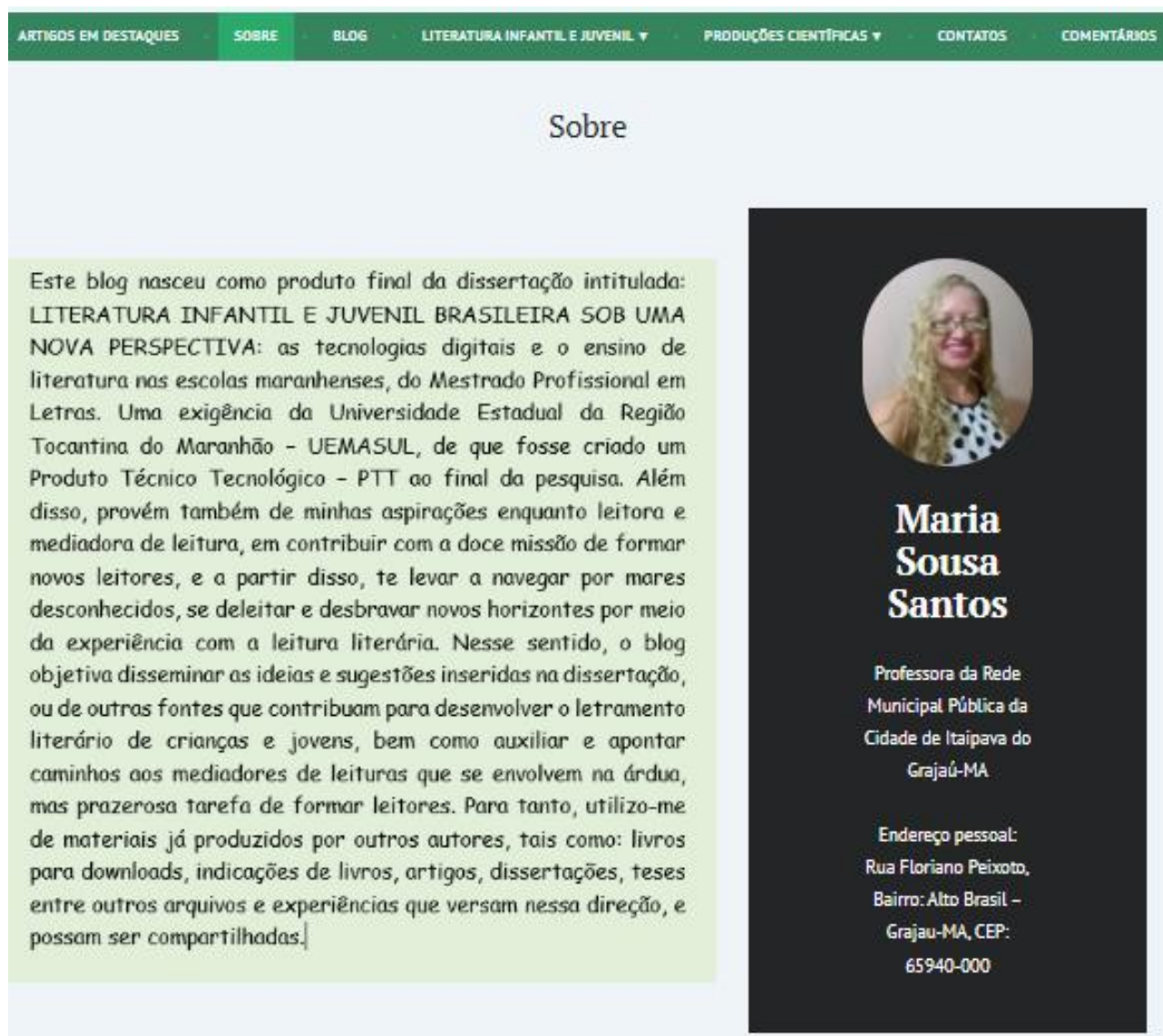
Figura 2: página Sobre .

A página Sobre traz as informações sobre a autora e origem do blog, que podem ser observadas na figura 2: