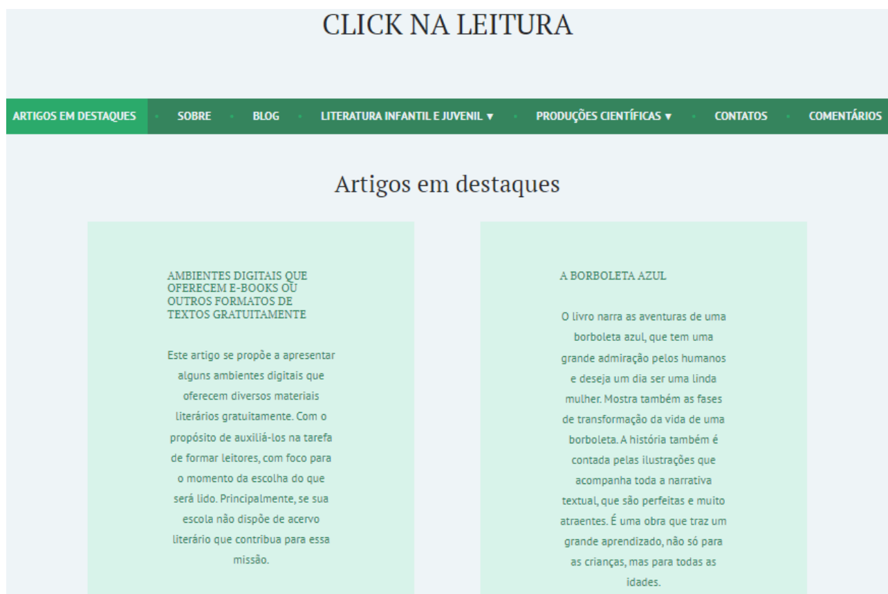
Figura 1: página Artigos em Destaque .

Na página Artigos em Destaque encontra-se as postagens que vão se destacando à medida que vão sendo postadas, como apresenta a figura 1.