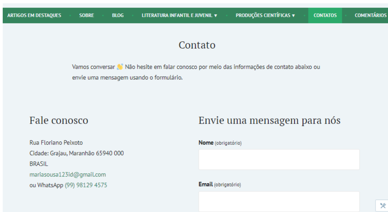
Figura 7 página Contatos .

A página Contatos traz os endereços por meio dos quais se pode entrar em contato com a autora do blog, como mostra a figura 7. Na página Comentário o leitor pode estar deixando seus comentários sobre as impressões que teve de sua visita ao blog.